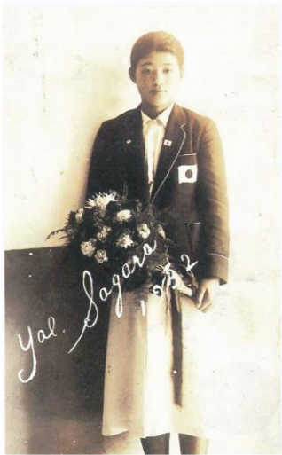
当時、人気を博したプロマイド