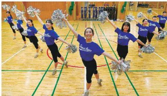
一糸乱れぬ演技を目指して練習中(高知市の土佐女子高)

「バトンの魅力は、お客さんを元気づけ、笑顔にできること」。そう話す土佐女子高校バトン部のメンバーの目には、悔しさと希望の両方にじんじんでいました。