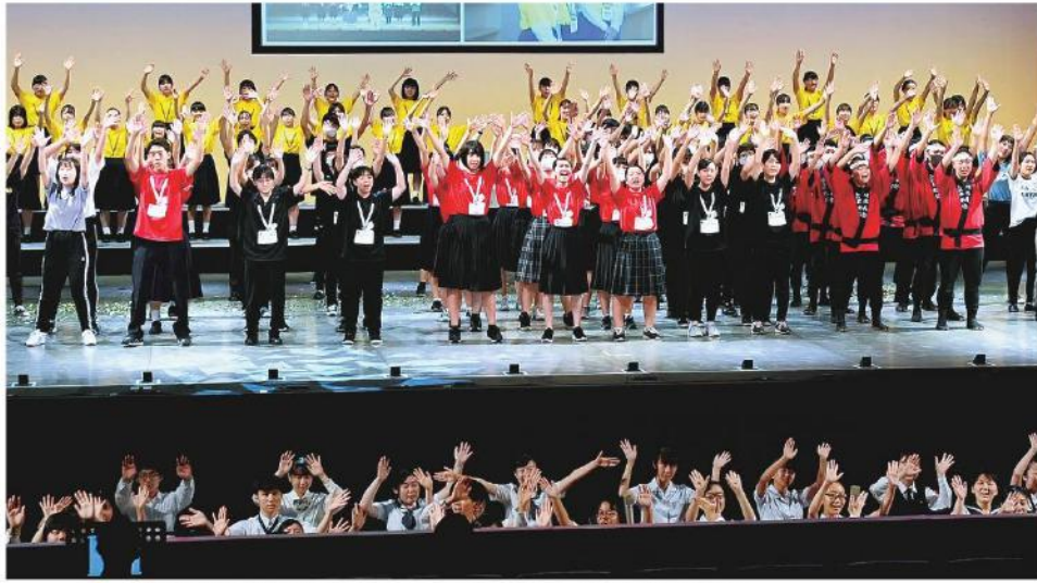
総合開会式グランドフィナーレで手を振る高知の高校生たち (6日午後、高知市の「かるぼーと」)

第44回全国高校総合文化祭「2020こうち総文」の総合開会式が6日、高知市九反田の市文化プラザ「かるぼーと」で行われた。新型コロナウイルスの影響で県外から来場できず、総文初のインターネットでライブ配信。「通常ではないこの総文が、皆さんの希望になるように」を誓い、全国の高校生との繋がりを文化の力で困難を乗り越えようとアピールした。