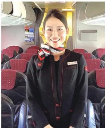
鴨田小、土佐女子中高、神奈川大卒。ジャルエクスプレスを経て、日本航空勤務。